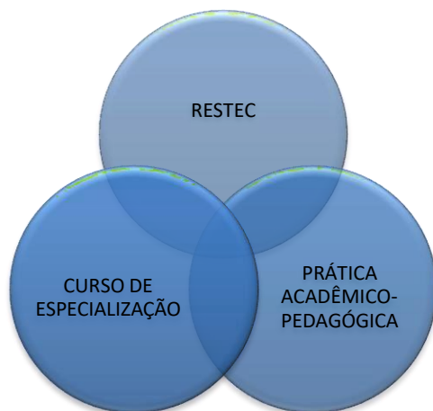
Figura 1 – Representação esquemática RESTEC (Nº 20086 DE 18/12/2019 e PORTARIA nº 006/2022 – GS/SETI)

O Programa de Residência Técnica em Segurança Pública será constituído de atividades práticas presenciais e/ou remotas nos diversos órgãos da Secretaria de Segurança Pública – SESP, parceira do projeto, associado à oferta do curso de especialização em Segurança Pública na modalidade à distância (EAD). (Figura 1)