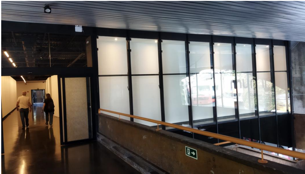
Vitrine da sala 1 do MUMA