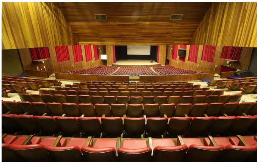
AUDITÓRIO MARIO SCHOEMBERGER - Espaço Liberdade - Barão do Rio Branco, 370 - Centro - Curitiba - PR

A Prática Artística é uma Disciplina Curricular dos Cursos de Música da UNESPAR, Campus de Curitiba I, EMBAP - Escola de Música e Belas Artes do Paraná.